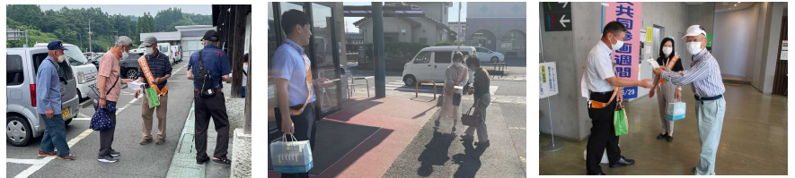
神楽会館、フレイン緒方店、三重町の集団健診会場で啓発キャンペーンを行いました。