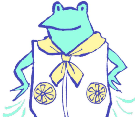
ファン付きウェア、 ネッククーラー