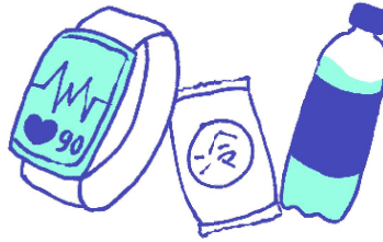
ウェアラブル端末、 応急セット