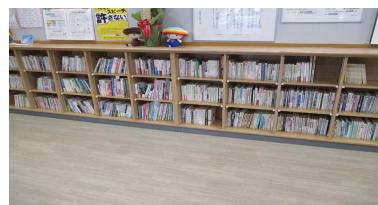
隣保館所有のコーナー