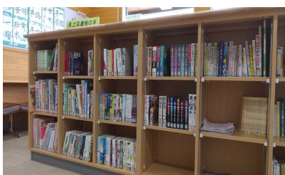
大分県立図書館のコーナー

大分県立図書館の書籍(200冊)を定期的に借入れています。4月に入替えを行いました。こちらも隣保館所有の図書と同様に貸出しをしています。