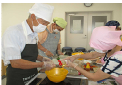
前回のメンズキッチンの様子