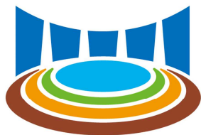
おおいた豊後大野ジオパーク Oita Bungo Ono Geopark